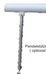
Pendelstütze höhenverstellbar (optional ohne Aufpreis)