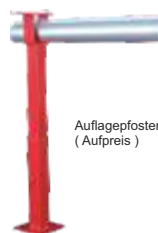
Auflagepfosten höhenverstellbar (Aufpreis)