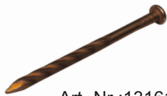
Art.-Nr.:13161-SN Ø 6 x L=105 mm