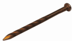
Art.-Nr.:13161-SN Ø 6 x L=105 mm